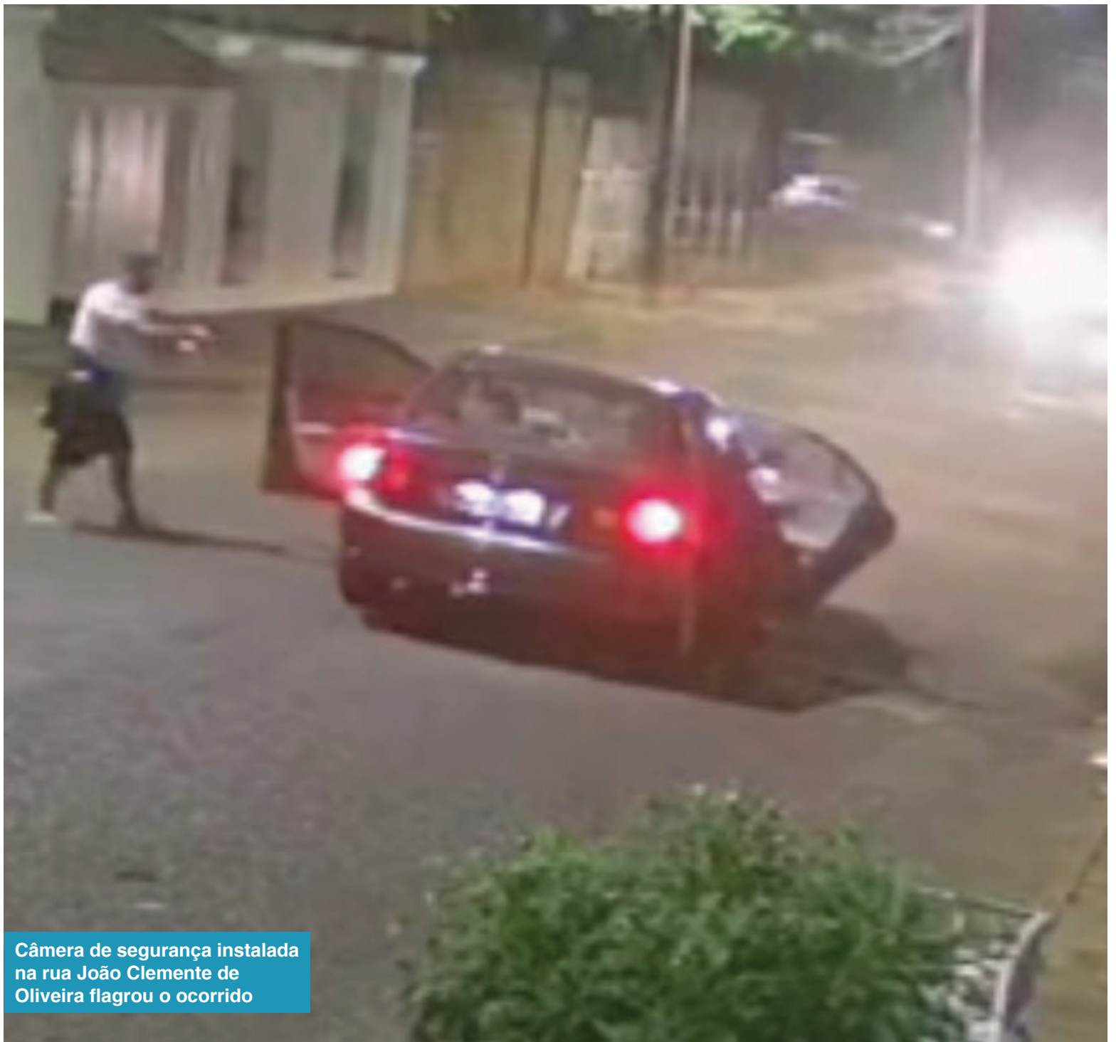
Câmera de segurança instalada na rua João Clemente de Oliveira flagrou o ocorrido